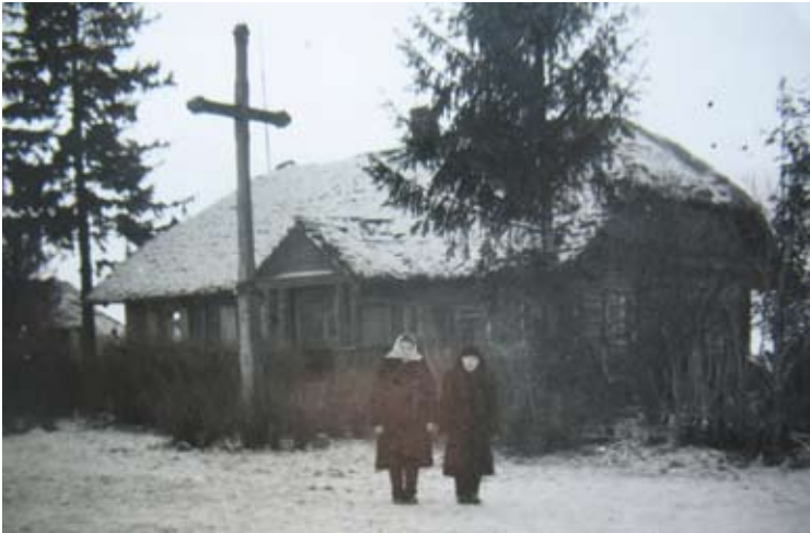
Balaišių sodyba, kurioje daug kartų lankėsi palaimintasis Teofilus Matulionis.

Melioracijai šluojant, tuštinant laukus neliko ir jaukios bei istoriškai svarbios Balaišių sodybos, kurioje ne kartą lankėsi šeiminių giminais, skiemoniškis, katalikų bažnyčios palaimintasis, arkivyskupas Teofilus Matulionis.