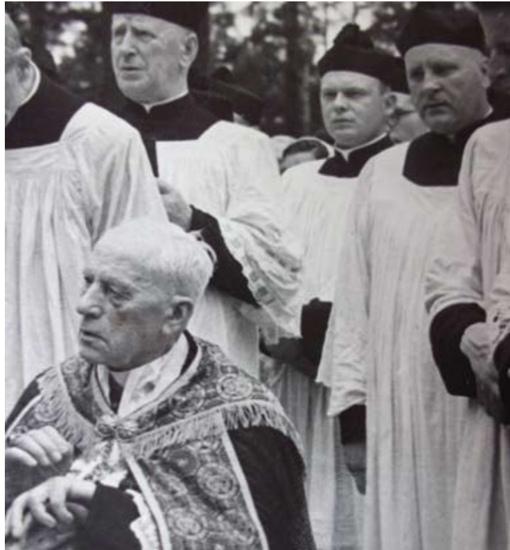
Vyskupas Teofilus Matulionis kunigų apsuptyje.

dešimčių lapų aprašas, istorijos, apie kokias pasakoja visų amžių šventųjų gyvenimus nušviečiančios knygos. Buvo girdėję apie Teofiliaus studijas Petrapilyje, apie darbus, sklaidžiant Kristaus tiesą, statant bažnyčias Latvijoje, apie dar vieną sugrįžimą į bolševikų valdomą, prievarta paženklinatą, jau Petrogradu tapusį miestą prie Nevos. Apie šiame dideliame mieste neįprastai sunkiomis sąlygomis statomą katalikų bažnyčią, proletarinės valdžios persekiojimus, metus, praleistus kalėjime ir išmainingą į Lietuvos bolševikus. Tuomet visoje Lietuvoje buvo rašoma ir kalbama apie grupę lietuvių kunigų, kuriuos sovietinė vyriausybė sutiko paleisti, jei mainais į Rusiją galės išvykti mūsų šalyje kalinti bolševikai. Saviškiai, tokie kaip Antanas Sniečkus ir kiti tėvynės išdavikai bei jos laisvės duobkasiai išvyko pas saviškius. Tuomet T. Matulionis jau atvyko kaip vyskupas. Lankėsi šioje sodyboje, pamaldos vyko Skiemonių bažnyčioje, Alantoje, kryžiaus pašventinimas, o po to kelionė į Romą, kelionė į Ameriką, net Afriką. Visą pasaulį apskriejusi žinia, kad jį su broliška meile sutikęs popiežius Pijus XI paprašė, kad pirmasis jį palaimintų vyskupas Teofilus, nes jis yra tikėjimo kankinys. Prieš išvykdamas į didžią kelionę, viešėjo